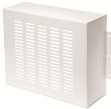
Рисунок 1 - Общий вид защитного кожуха

1.2 Общий вид защитного кожуха показан на рисунке 1.